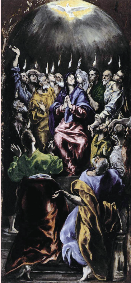
성령 강림(엘 그레코 작, 1541)